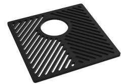
Grille Black 8100 651